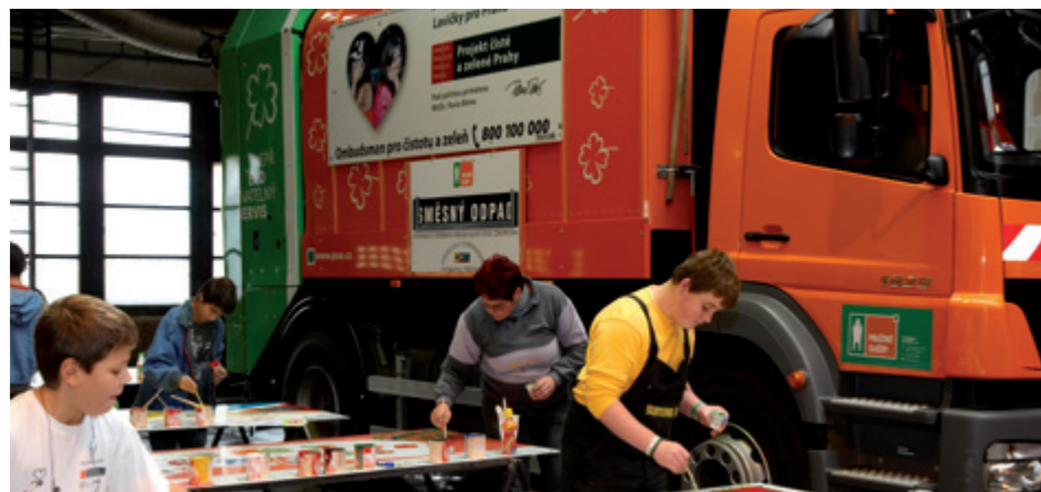
Mladí umělci v akci tvoří přímo v areálu Pražských služeb, a.s.